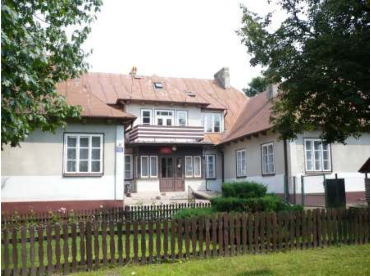
Szkoła Podstawowa w Żyrzynie w zakresie klas 0-6 mieści się w wyremontowanym budynku.